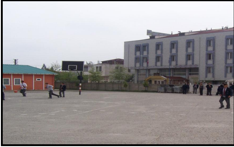
Resim 1.2: Okul bahçesi

Havanın yağışlı olduğu ve bahçeye çıkmak için uygun olmadığı durumlarda, öğrencilerin gezinme, hava alma ve oyun ihtiyaçlarını karşılayacak spor salonu gibi alanların bulunması gerekir.