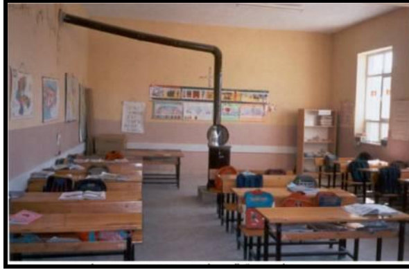
Resim 1.13: Soba ile ısıtılan sınıf ortamı