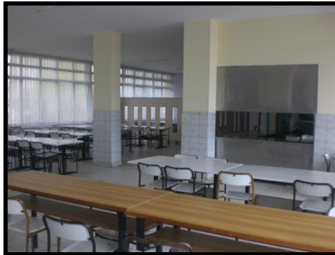
Resim 1.6: Okul yemekhanesi