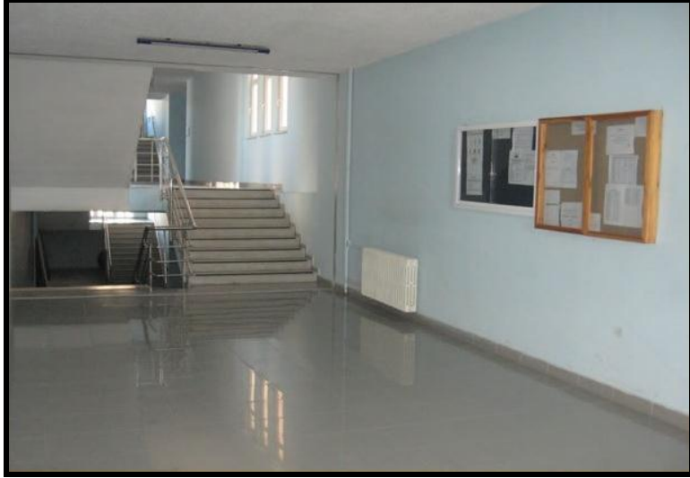
Resim 1.5: Okul koridoru ve merdivenler

Okul içi merdivenleri, inilip çıkması kolay; kullanılan malzeme ise kaymayan özellikte olması gerekir.