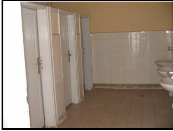
Resim 1.8: Okul tuvaletleri

Tuvaletlerin, kız ve erkek öğrenciler için ayrı gruplar halinde olması gerekmektedir. Sağlık kurallarına uygun olarak tuvaletler; kokusuz, temiz, bakımlı ve öğrencilerin kolayca yararlanabileceği yükseklikte olmalıdır.