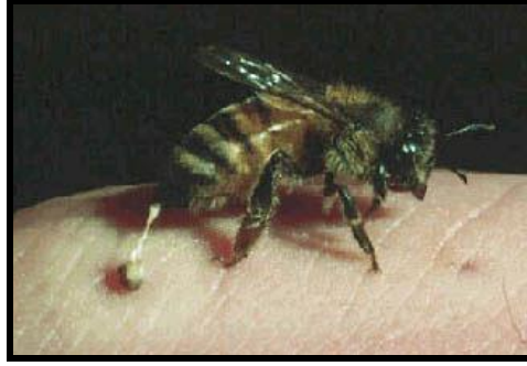
Resim 1.18: Arı sokması