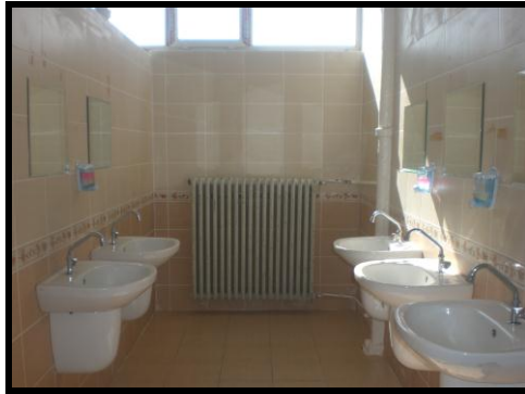
Resim 1.10: Lavabolar

Okulda içme su kapları ortak kullanılmamalıdır. Lavabonun iç kıvrımı porselen, paslanmaz çelik ya da mermerden olmalı; su çıkış ağız ise okside olmayan metalden yapılmalıdır.