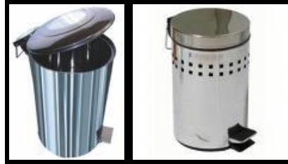
Resim 1.9: Pedallı çöp kovaları

Lavabolar da öğrencilerin rahat kullanabilecekleri yükseklikte olup yanlarına ayakla açılabilen pedallı çöp kovası konulmalıdır. Lavaboların çevreye su sıçramasına engel olacak genişlikte yapılması gerekir. Ayrıca sabun ve ayna olması gerekir.