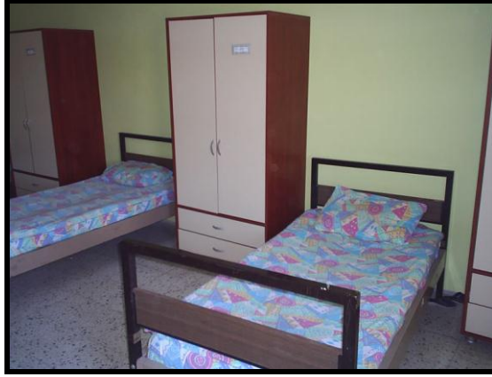
Resim 1.7: Yatakhane