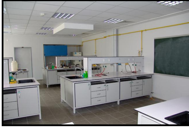
Resim 1.12: Laboratuvar

Bir sınıftaki aydınlatma seviyesi en az 250 lüks olmalı, yemekhane gibi diğer bölümlerde ise 150 lüksten az olmamalıdır.