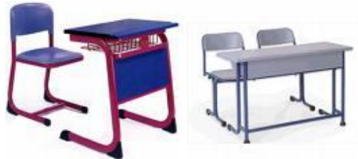
Resim 1.4: Okul sıraları

Oturma yerinin, öğrenci arkaya dayanarak oturduğunda düz bir şekilde döşeme üzerinde durabilmesini sağlayacak kadar, uyluk kemikleri oturduğu yere değecek şekilde olması gerekir. Sıra ve masaların genişliği, öğrencilerinin dizlerinin rahat hareket edebilecekleri şekilde olmalıdır. Ayrıca yüzeyleri pürüzsüz, cilalı ve temiz olmalıdır.