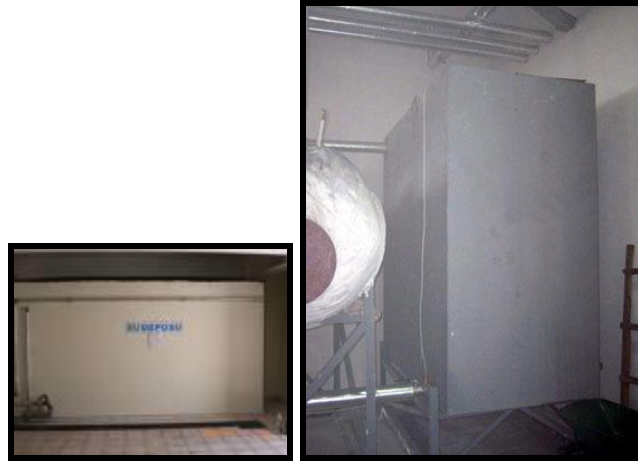
Resim 1.11: Su depoları

Depoların giriř ıkıř baėlantıları ve en alt seviyede tahliye vanası olması gerekir. Tahliye vanası ıkıř deliėi zerinde olmalı ve deponun i yzeyi de kolay temizlenir malzemeden yapılmalıdır. Bunun iin de fayans uygundur.