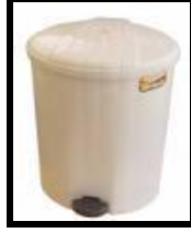
Resim1.1: Pedallı çöp kovası

Öğrencilerde çevre bilinci geliştirmek amacıyla kağıt, metal, cam ve plastik atıklar için geri dönüşüm kutuları koymak faydalı bir uygulamadır.