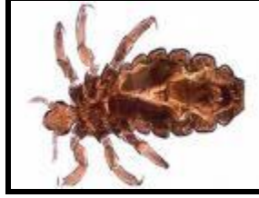
Resim 1.15: Vücut biti

Tedavide %5 permetrin krem kullanılır. İç çamaşırları, giysiler ve yatak takımları yıkanmalı ya da kuru temizlemeye verilmelidir. Ayrıca sıcak ütü ile ütülenmesi gerekmektedir. Hastanın temizlik alışkanlıklarının düzeltilmesi gerekir. Haftada en az 2 kez sıcak banyo yapıp iç çamaşırlarını sık değiştirmesi önerilir.