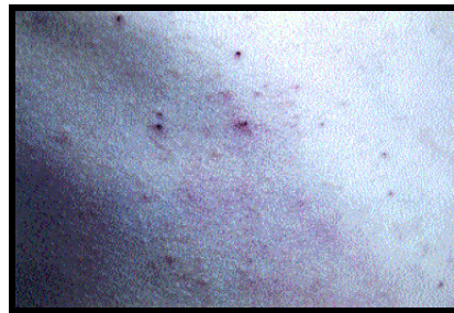
Resim 1.16: Uyuz

Klasik uyuzda deri lezyonları; bilekte, dirsekte, el ve parmak aralarında bel bölgesinde, göbekte, koltuk altı çukurunun ön yüzünde, kadınlarda meme başı çevresinde, erkeklerde glans peniste, ayak bileklerinde ve dizlerde görülür. Kaşıntının özellikleri tanı koymada yardımcıdır.