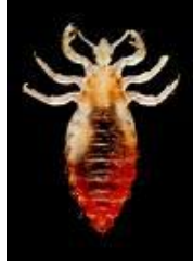
Resim 1.14: Baş biti

Tedavide, %1 permetrin içeren krem ve şampuanlar kullanılır.